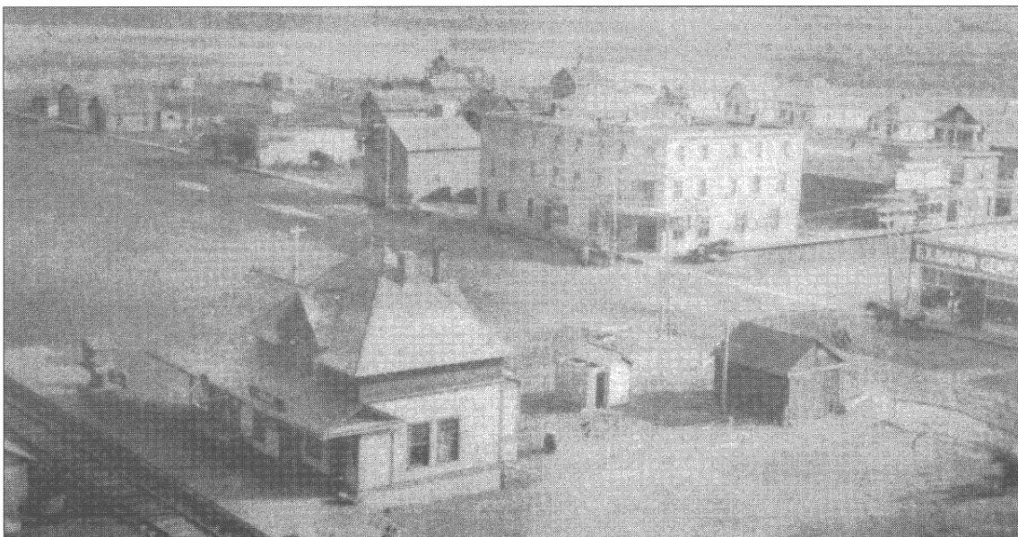
Edam in Canada in vogelvlucht. Links onder het station, 1920