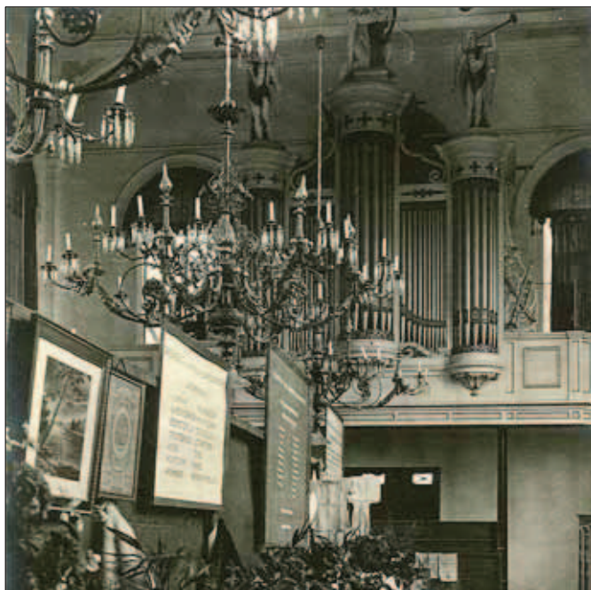
Interieur oude Purmerkerk

In 1972 had de Purmer 782 inwoners. In die tijd behoorde de grootste groep tot de Ned. Herv. Kerk (340), waarvan minder dan de helft belijdend lid was. Tot de tweede groep behoorden de Rooms-Katholieken (265). Verder nog enkele Gereformeerden, Doopsgezinden en Lutheranen. Een aantal van 103 inwoners was onkerkelijk. Door verstedelijking, als gevolg van een planologische ingreep en kerkverlating zullen deze getallen nu totaal anders zijn. De katholieken in de Purmer bleven door de eeuwen heen een minderheids-groepering en tot op de dag van vandaag zijn zij aangewezen op de kerken in de omliggende plaatsen. Vele katholieke boeren die in Edam naar de kerk gingen hebben in de loop van de eeuwen een belangrijke bijdrage geleverd aan de groei en bloei van de rooms-katholieke parochie. Zij zaten vaak in de besturen van de kerk, de armenzorg, het weeshuis en het onderwijs, maar bovendien hebben zij door middel van schenkingen, legaten en fundaties, vele initiatieven en ontwikkelingen van de R.K. kerk in Edam mogelijk gemaakt.