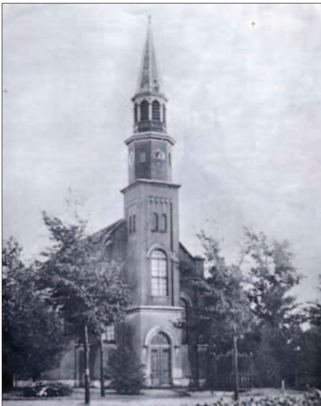
Purmerkerk gebouwd in 1865 en in 1959 verbrand

Voor de droogmaking van de Purmer werd een octrooi (overeenkomst) opgesteld waarin o.a. voor de eredienst werd gezorgd. Het honderdste morgen land werd tot onderhoud van de kerk van de kerkelijke diensten bedongen, maar het zou nog lang duren voordat er eindelijk een kerkgebouw van de Nederlands Hervormde gemeente werd gebouwd. Wel was er een afspraak dat de dominees van de gereformeerde kerken uit Edam, Monnickendam, IJpendam, Purmerend en Kwadijk een jaarlijks traktement van 25 gulden kregen voor het verlenen van geestelijke bijstand aan de Purmerbewoners. Voor dit bedrag moesten zij zieken troosten, de armen in hun nood bij te staan, catechisatie geven en trouwlustigen op hun huwelijk voor te bereiden. Gelijktijdig konden zij proberen om de rooms-katholieken op andere gedachten te brengen.